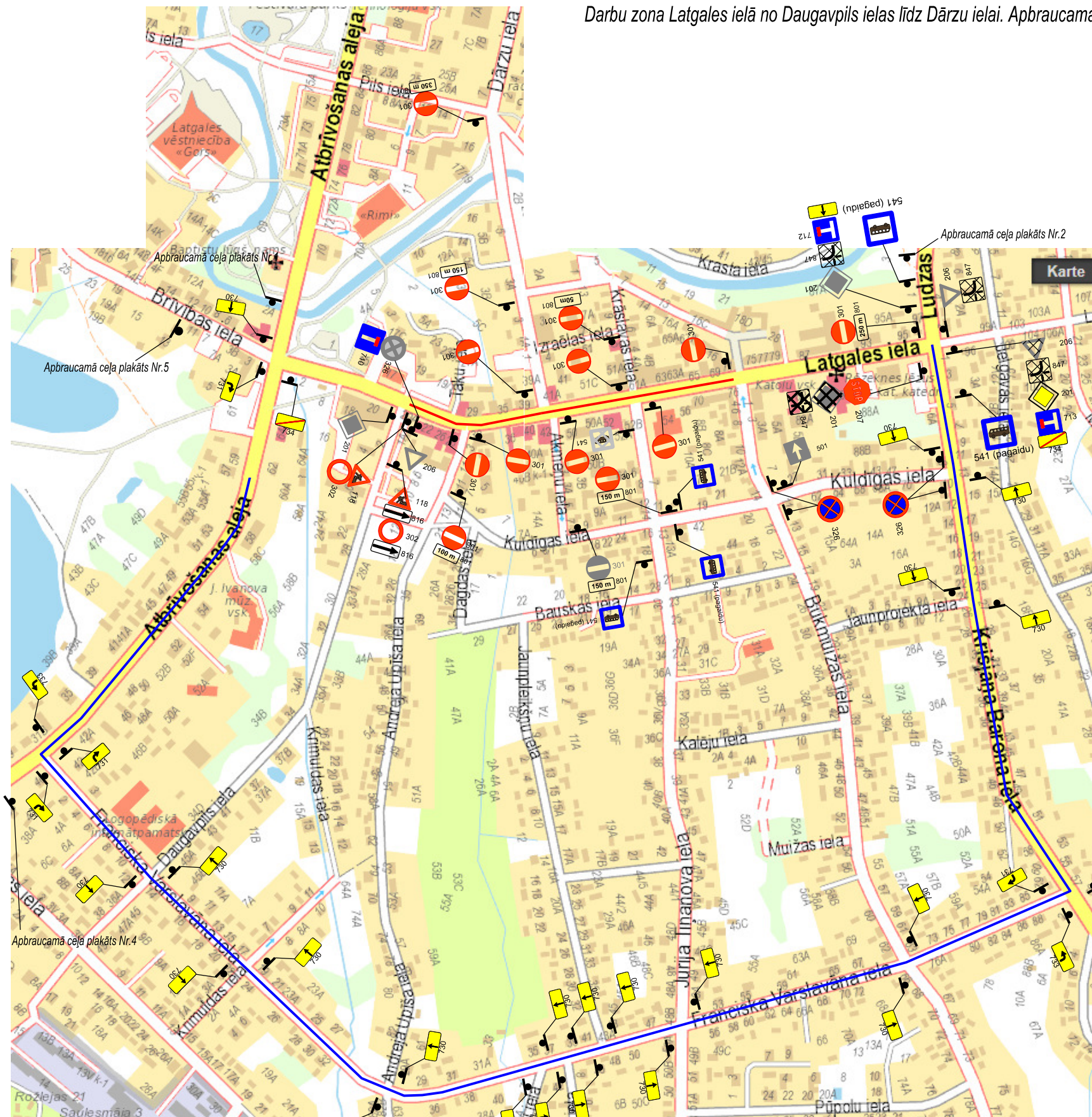
Apraucaamo ceļu plakāti

Darbu zona Latgales ielā no Daugavpils ielas līdz Dārzu ielai. Apraucaamais ceļš: Atbrīvošanas aleja - F.Varslavāna - Kr.Barona iela.